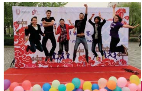
2015年中欧学院承办上海大学第九届中法文化节