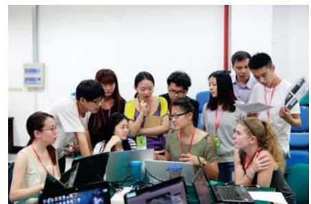
加拿大魁北克·第六届国际24小时创新大赛 由中、法、加三国不同专业学生组成的团队获得全球亚军

中欧学院一直致力于中法文化的交流和促进工作。自2006年起，学院每年举办中法文化节，目前已经成功举办八届。中法文化节一般历时两个半月，十多场主题活动，每年有近2500人次的中外学生享受这一场场文化盛宴。