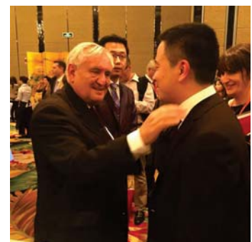
法国参议院副议长(前总理)拉法兰 与中欧06级毕业生叶伟达 (曾任上海施耐德电气公司市场部经理 现为上海培路文化传播有限公司CEO)